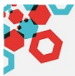
TABLEAU DE BORD DIRECTION SANTÉ

Découvrez l'intégralité de l'étude sur www.mutweb.fr