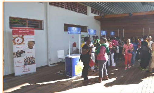
Assemblée Générale de la CGSS Stand – 30 janvier 2015