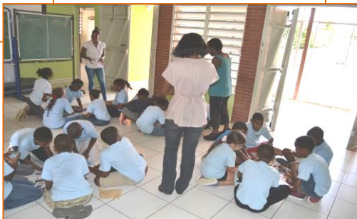
Atelier nutrition 03 et 05 mars 2015- Ecole primaire la Jaille