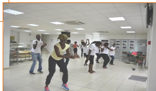
Atelier nutrition et activités physiques 13 et 20 mars 2015 Ecole Régionale de la 2 ème Chance