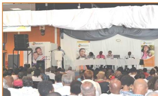
Assemblée Départementale MGEFI 16 avril 2015 - Gosier