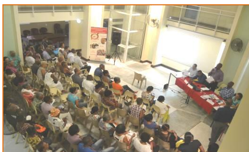
Conférence « le médicament » 18 avril 2015 - Baie-Mahault