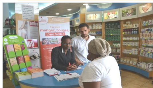
En avril, mangez, bougez c'est facile Stand - 21 et 23 avril 2015