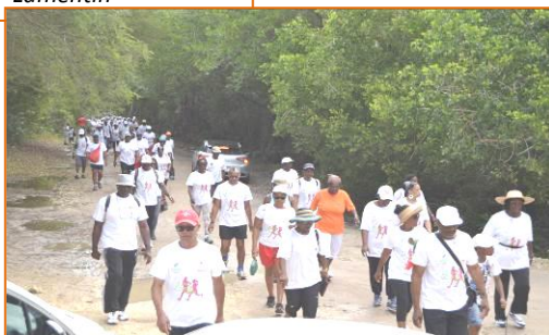
Parcours du cœur 12 avril 2015 - Gosier