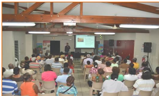
Conférence « AVC, prévenir pour éviter des conséquences graves » 24 janvier 2015 – Capesterre B/E